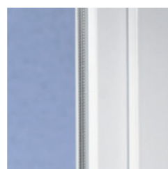
Klassisches Design mit weicher Kontur

Mit modernen Kunststofffenstern aus VEKA Profilen gewinnt jedes Haus. Denn das klassische Design des SOFTLINE Systems mit der leicht abgerundeten Kontur ist zeitlos und harmonisiert hervorragend mit unterschiedlichsten Architekturstilen – ob modern oder traditionell, ob Neubau oder Renovierung.