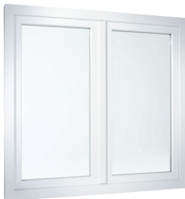
2-flügeliges Fenster in flächenversetzter Variante

Und auch die Technik im Inneren überzeugt: Die Mehrkammerprofile nutzen die isolierende Eigenschaft von Luft und erfüllen so höchste Anforderungen an die Wärmedämmung. Das sorgt nicht nur für angenehmes Raumklima bei jedem Wetter, sondern hilft auch im Winter, die Heizkosten spürbar zu senken.